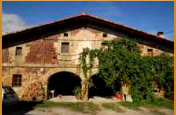
SAN JULIAN (Iurreta)