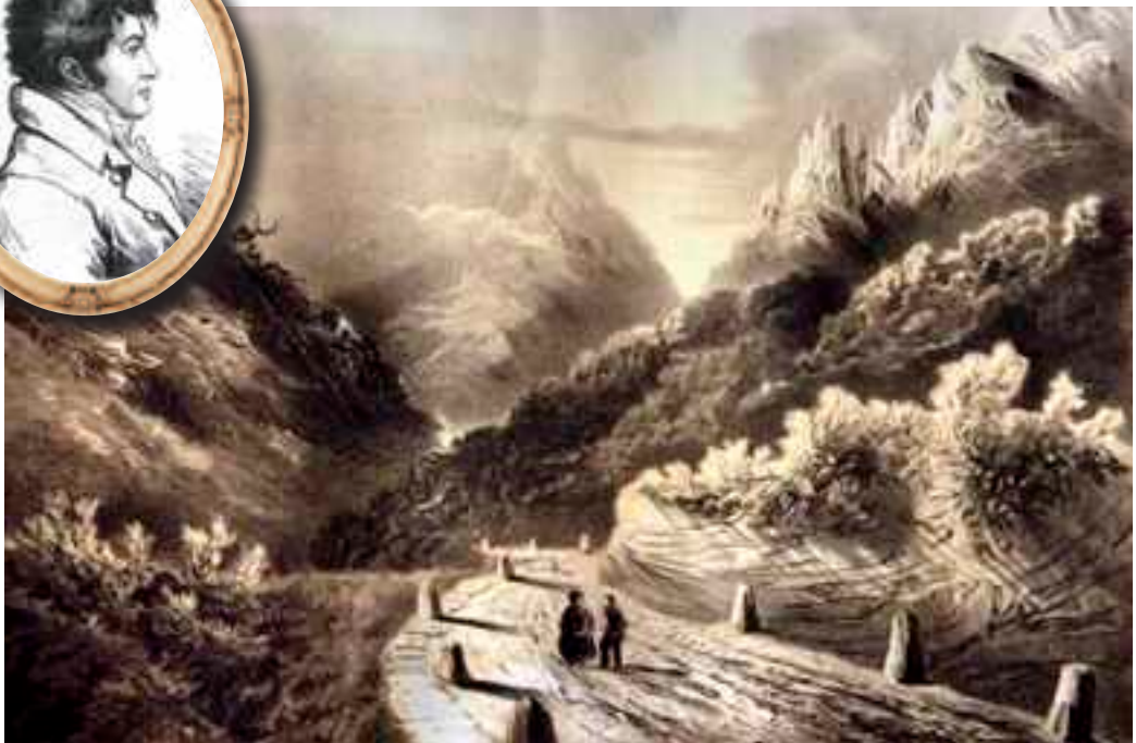
Grabado del camino de Urkiola a Mañaria. Siglo XIX.