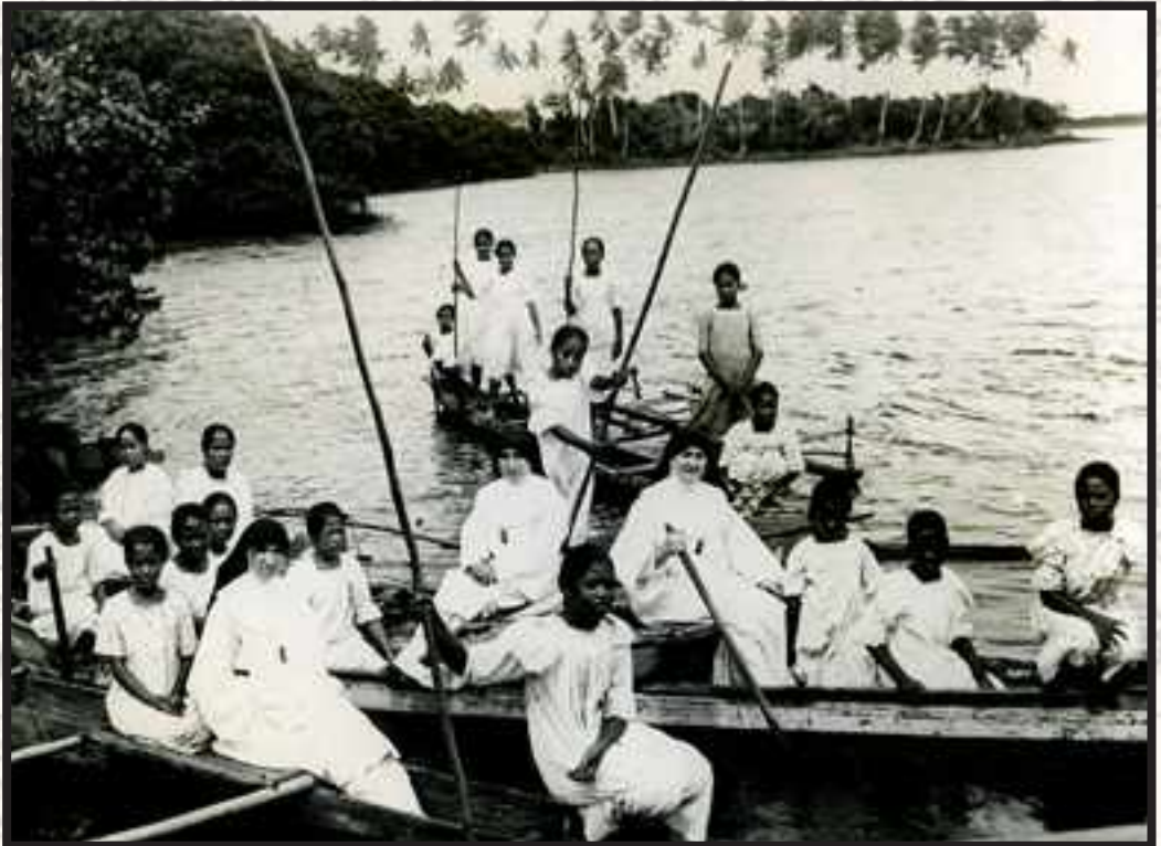
Goian: Congo / Behean: Mikronesia