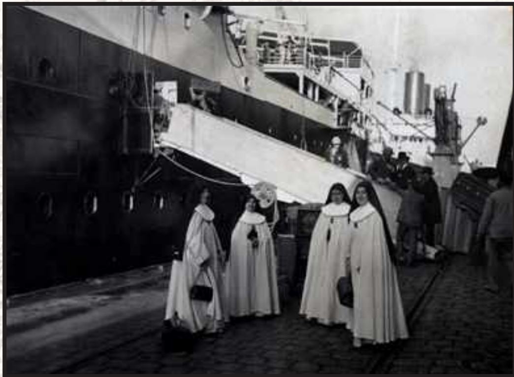
Bigarren bidaiaren hasiera

urrutiko “fedegabeak” ikusteaz gain, bertako arazoak ere ikusten zituzten; alegia, etxean ere misiolari izan zitekeela uste zuten.