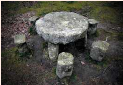
📷 Laisiarko mahaia.

Modu horretan, Erdi Aroko funtzioak galduta izan arren, basoak zaintzeko eta administratzeko ardur hartu zuten lurretako sei kofradiak. Ibilbide berri horiez zen oztopoetatik salbu egon. 1926an Duran-