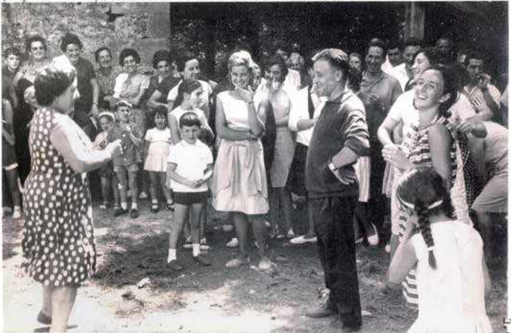
Urtea · 1.964. Navi Alzero Aldeko Txikiako Justori aurrestua esiten.