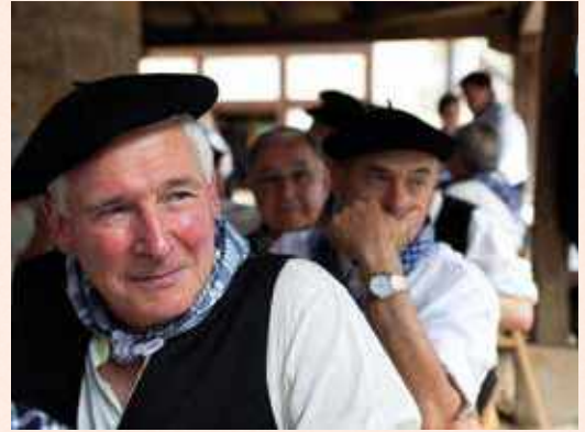
📷 Kofradi eguna Gazetan, 2018. Patxi Granado

bideratzea. Kofradeen zerrenda-egile bat egotzen eta auzotarren dohaintzak batzen zituen pertsona ere bai. Kofradiak, funtzio administratiboak, sozialak eta erlijiosoak zituen. Administrazioen kasuan, inguruko baliabideen ustiapena zegoen. Maila sozialean, kideen arteko gatazkak konpontzea zen ardura nagusia. Erljio ikuspuntutik, adibidez, derrigorrezkoa zen hildako kofradiakideen hiletetara joatea. Gerora, kutsu erlijioso hutseko kofradiak sortu ziren Elorrioren eta horri buruz ere ikertu zuen Muñizek.