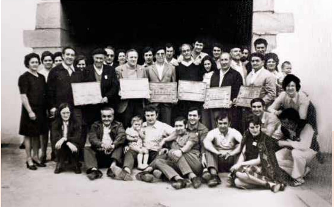
📷 Omenaldia Kofradietako "gizon onei". Goiuria 1973

San Markoskoentzat, Keizaga Txikia Goiurikoentzat eta Keizaga Nagusia Orozketakoentzat.