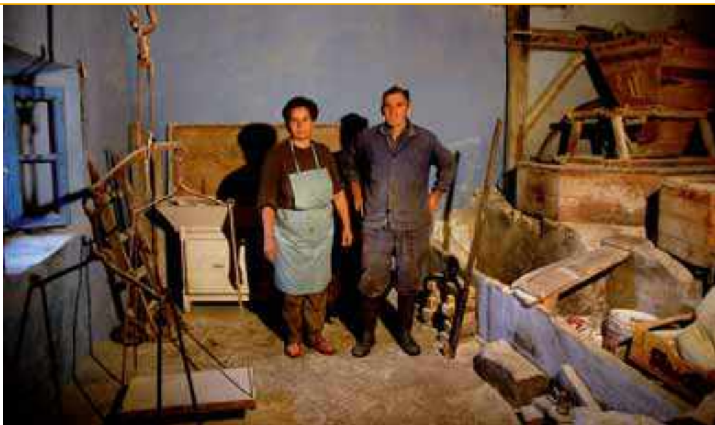
Anporta errota-baserria (Berriz)