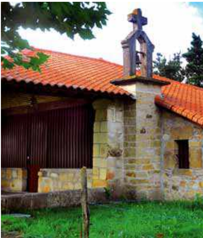
San Pedro txiki ermita

Garaira doan kaminora heltzen garenean Jandustegi behekoa (Beketxe) dugu eskuman, Mantoena baserriak bidez beste aldean, eta ondoan orain 4 urte berriztatutako San Salvador eta San Klemente ermita.