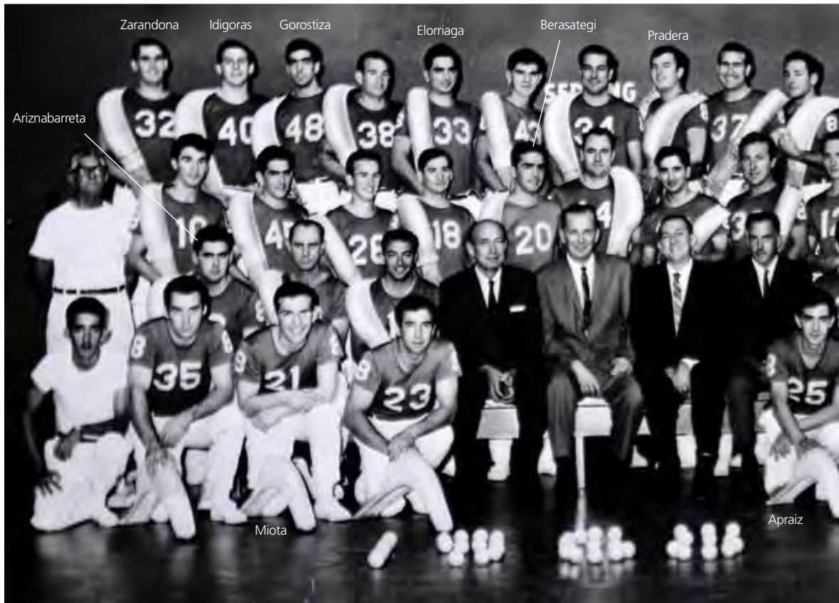
○ Durangaldeko pelotariak. Seminole Jai Alai. Orlando.

Hemen, Estatu Batuetan, kotxez joan behar da leku guztietan, ez da Durangon bezala, pasioan irten, jendearekin elkartu, berriketan hasi, txikiteoan joan, edo afaltzera... Hemen Miamin, pozak eta penak denak etxera eramaten dituzu, eta askoz ere elkarriketa gutxiago dago. Bizimodua bakartiagoa da, eta hasieran gogorra da.